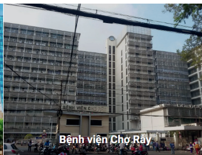
Bệnh viện Chợ Rẫy