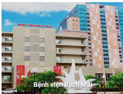
Bệnh viện Bạch Mai