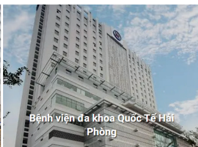
Bệnh viện đa khoa Quốc Tế Hải Phòng