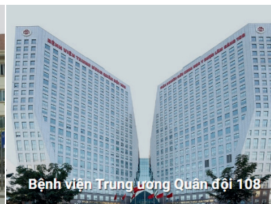
Bệnh viện Trung ương Quân đội 108