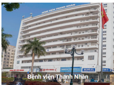
Bệnh viện Thanh Nhàn