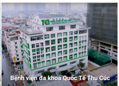
Bệnh viện đa khoa Quốc Tế Thu Cúc