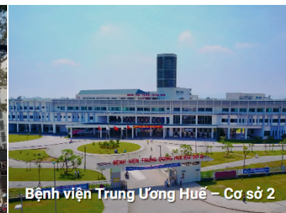
Bệnh viện Trung Ương Huế – Cơ sở 2