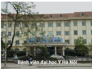
Bệnh viện đại học Y Hà Nội