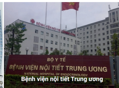
BỘ Y TẾ BỆNH VIỆN NỘI TIẾT TRUNG ƯƠNG NATIONAL HOSPITAL OF ENDOCRINOLOGY Bệnh viện nội tiết Trung ương